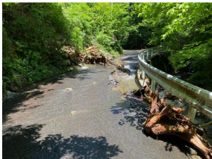
町道110号 西川豊邦線