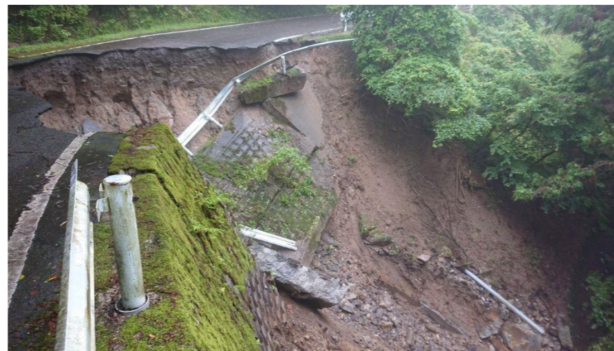
町道307号 名倉津具線